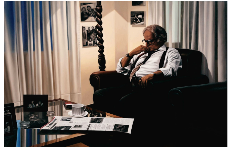
SET / Don Guillermo Cano / 106 x 160 cm / Oleo sobre tela. Escena que registra a Guillermo Cano, director del periódico El Espectador

Es una instalación que reúne las lógicas del dispositivo museográfico con las de la utilería teatral, albergando en una ficción espacial un conjunto de obras que se articulan alrededor de un espacio museal ficticio, una arquitectura superficial inspirada en el interior del Museo Metropolitano de Nueva York Este escenario acoge un grupo de 17 pinturas al óleo de aspecto foto realista y un video mono canal sin audio Las primeras son versiones pictóricas de tomas de foto fija, realizadas durante el rodaje de Escobar, El Patrón del Mal, de Caracol TV Las imágenes registran el aspecto de escenas que a su vez fueron basadas en eventos reales de gran relevancia en el contexto de la guerra entre el estado y el cartel de Medellín en los 80`s y 90`s. Situaciones y personajes que, por su importancia, fueron producidas con espacial interés y rigor por la serie de televisión Y que aquí son reconstruidas sumándoles la carga simbólico de la pintura como un soporte de carácter histórico.