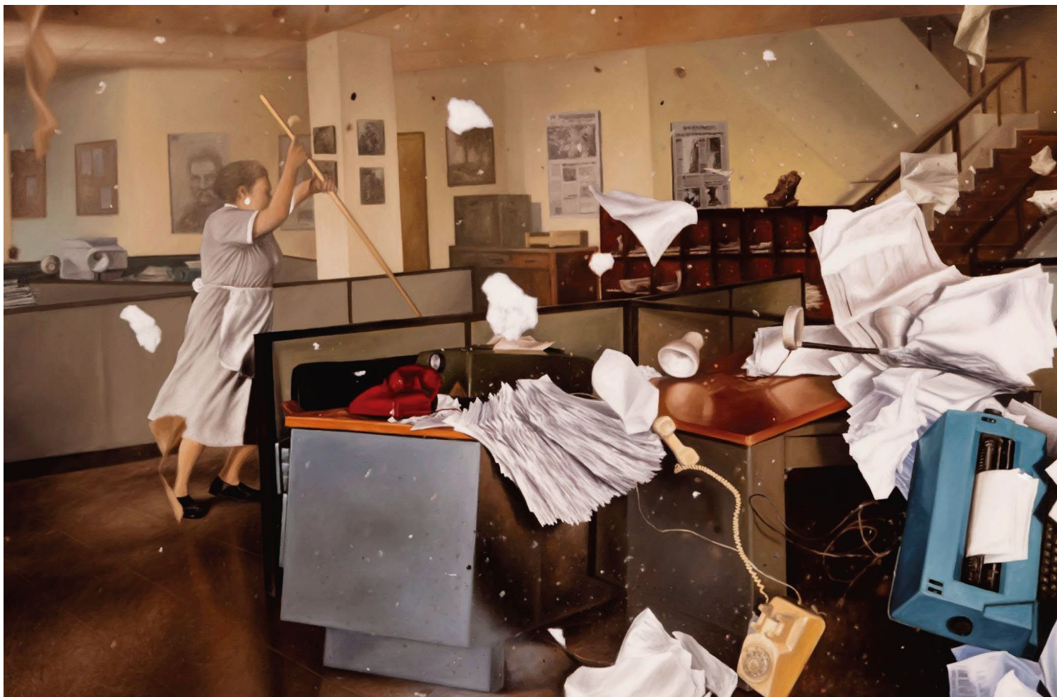
SET / Periódico I / 86 x 130 cm / Oleo sobre tela. A partir de la escena que da cuenta del atentado perpetrado en contra del periódico El Espectador, realizado por el cartel de Medellín en 1989.

La alusión a un Museo Nacional, con sus acabados, y escala monumental funciona en el marco de la instalación como un dispositivo de legitimidad, en el que la relación imaginaria con las imágenes recuerda el tiempo en el que la pintura hacía parte del monopolio de representación según el cual el aspecto histórico podía ser consignado por un autor sin necesidad de ser corroborado una relación que en definitiva hoy no podría ser aceptada y en la que por el momento formatos como el documental, el noticiero y el video aficionado parecen ser la vanguardia.