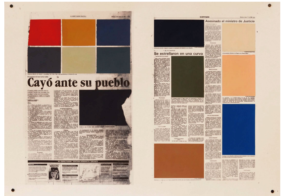
Hemeroteca Ante su Pueblo / Impresión Digital, Oleo sobre Papel / 100 x 70 cm

Los chicos deberán socializar sus trabajos, y comentar que fue lo que más les gustó del ejercicio.