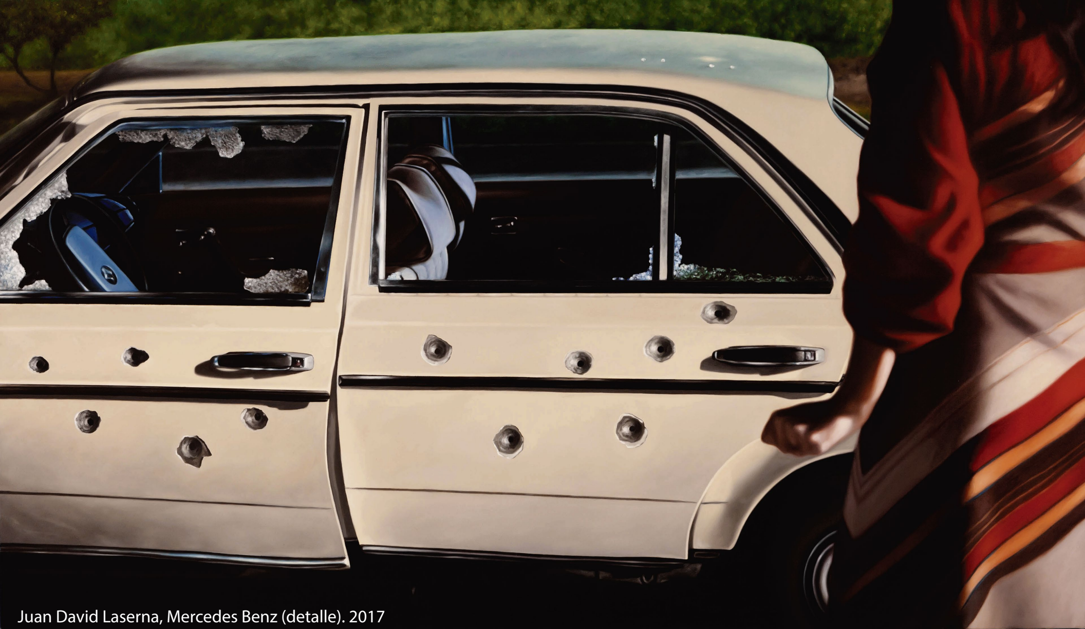
Juan David Laserna, Mercedes Benz (detalle). 2017