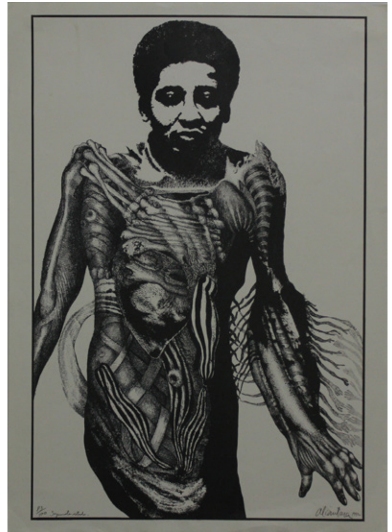
Pedro Alcántara/Sin título/ 69.3 X 49.7 cm / Serigrafía.

Los chicos deberán socializar sus trabajos, y comentar que fue lo que más les gustó del ejercicio.