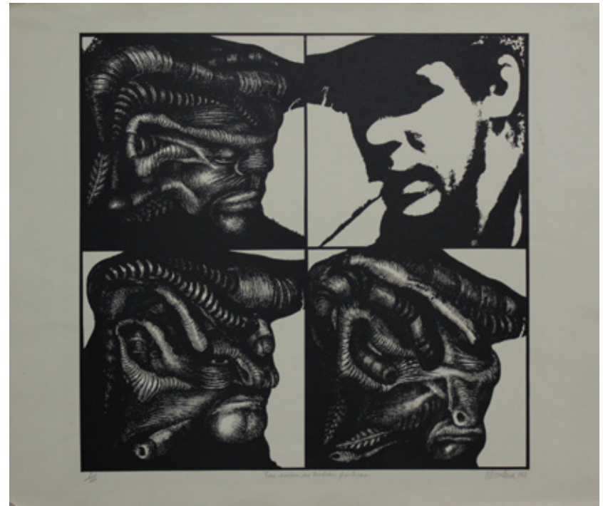
Pedro Alcántara/Tus sueños no tendrán fronteras. / 49.7 x 58 cm / Litografía

La muestra ofrece dos ejemplares de dibujos que hicieron parte de las exhibiciones del Nadaísmo y al tiempo documentos de estas muestras. Luego se concentra en obra gráfica y se presenta ejemplares de seis series: Tus sueños no tendrán fronteras de 1968 que aluden al Che. El conjunto de caras impresas entre 1968 y 1970. Los trabajos denominados Retrato de un guerrero de 1972. Las páginas del libro El mal y el Malo basado en poemas de Pablo Neruda fechadas en 1974. Estampas de la serie La Danza de la Muerte referenciadas con impresos del pintor del alto renacimiento alemán Holbeim y con sentencias lapidarias del profeta Isaías que se imprimieron en serigrafía en 1976. Finalmente, ejemplos del portafolio en homenaje al héroe, intelectual y político cubano José Martí de 1979.