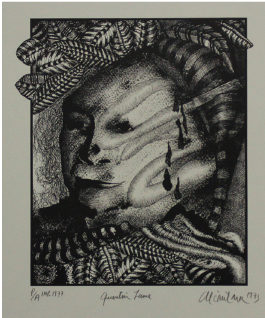
Pedro Alcántara/ Retrato de Quintín / 50 x 33 cm / Litografía

Su estética neo-figurativa fue un síntoma de época. Entre sus colegas que practicaron esos lineamientos podríamos nombrar a Augusto Rendón, Luis Caballero, Carlos Granada, Leonel Góngora y Norman Mejía. Este último se involucró junto con Alcántara en las exhibiciones que organizaron los Nadaístas, el grupo de disidencia cultural comandado por Gonzalo Arango. La producción de Alcántara en los años sesentas adoptó la tinta china como un ingrediente para elaborar sus propuestas desenfadadas que hacían comentarios políticos, anticlericales y sexuales, asombrando y confrontado a los espectadores de su época.