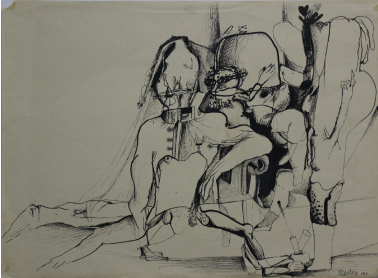
Pedro Alcántara/La familia casta o la casta general/49 x 68.5 cm / Serigrafía

De la producción dibujística el artista pasa a interesarse por la obra gráfica y su capacidad de penetración a través del original múltiple. Las litografías y luego las serigrafías enseñan con suficiencia la destreza de la línea para construir los rostros y cuerpos que son el centro de su argumentación. Ambos desollados y violentos para apelar a la catarsis del observador.